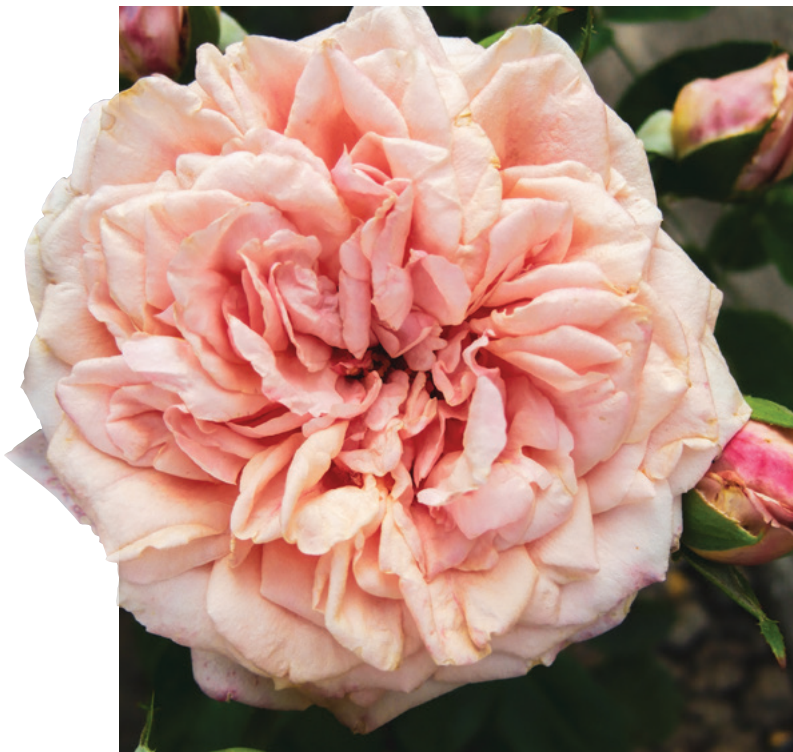
Anglický šľachtic priemyselnej revolúcie – Abraham Darby.

Najdôležitejším z nich je podľa mňa jedinečný pomer ceny a kvality. Ide o kľúčový vzťah medzi investovanými financiami, preukázanou starostlivosťou a výslednou úžitkovou hodnotou, ktorú nám je tento jedinečný kvet schopný vytvoriť. A táto hodnota je pre mňa osobne dostatočne veľká na to, aby som pestovanie ruží aj v skromných podmienkach všetkým mojím kolegom iba odporučil.