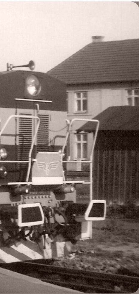
Motorový rušeň T 457.0011 + krytý nákl. vozeň v žst. Nymburk město. Pohľad predobočným. Perónne hrany, vpravo vzadu obytná dom. Trolej. Anon., cca 1988. 147 x 103

BRATISLAVA — ČKD vyrobilo v roku 1979 tri prototypy rušňov T 457.0. Rušeň T 457.0001 bol zapožičaný do rušňového depa (RD) Praha-Vršovice, kde slúžil na posun v zriaďovacej stanici. Rušeň T 457.0002 prešiel skúškami na známom skúšobnom okruhu VÚŽ v Cerheniciach. Práve skúšky T 457.0001 na trati Praha-Vršovice — Vrané nad Vltavou — Dobříš (52 km) priniesli cenné poznatky. Od 12. do 14. novembra 1979 panovalo meniace sa počasie vrátane námrazy na koľajniciach, čo zabezpečilo ideálne podmienky na test trakcie.