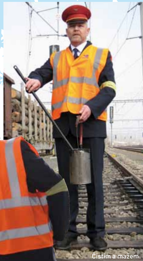
Čistím a mažem.