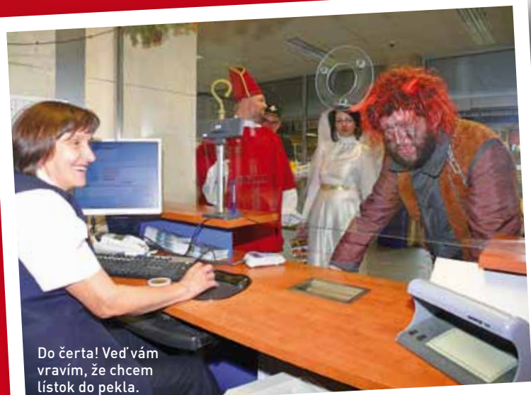
Do čerta! Veď vám vravím, že chcem lístok do pekla.