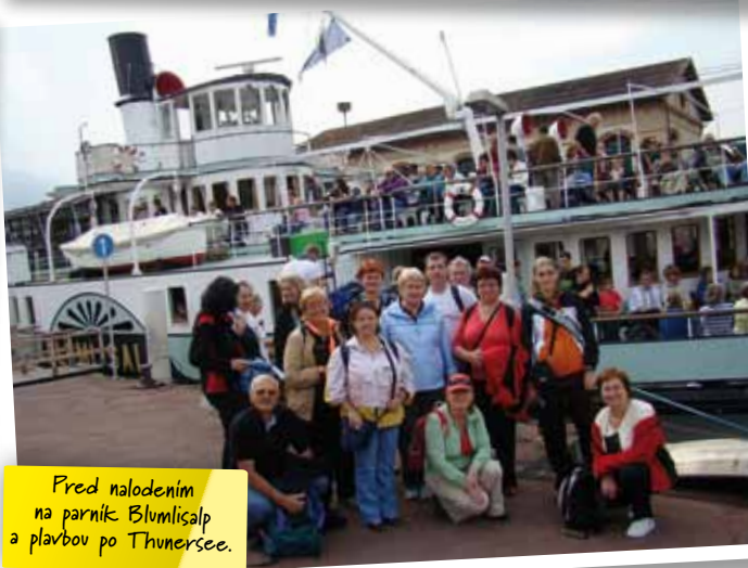
Pred naložením na parník Blümlisalp a plavbou po Thunersee.

ré tu žili, ako Freddie Mercury a Charlie Chaplin. Po prehliadke najkrajšieho hradu krajiny – Chillon – nasledovala aj plavba loďou po jazere.