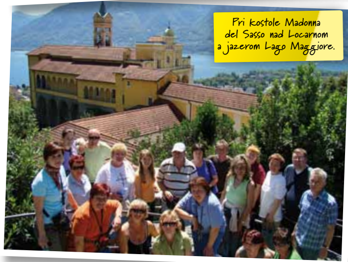
Pri kostole Madonna del Sasso nad Locarnom a jazerom Lago Maggiore.