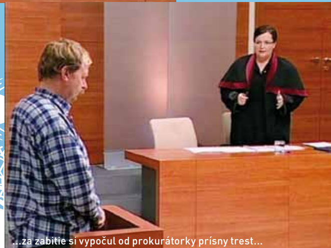
...za zabitie si vypočul od prokurátorky prísny trest...

pracuje vrah dieťaťa... Tiež si v danom okamihu neuvedomila, že ide len o rekonštrukciu trestného činu v podaní amatérskych hercov. - Mal som z toho zmiešané pocity. Pri pozvánke na natáčanie ďalšej časti som po týchto skúsenostiach uvažoval, či ďalšie vôbec prijmem. Dal som sa prehovoriť, tak som potom ešte účinko-