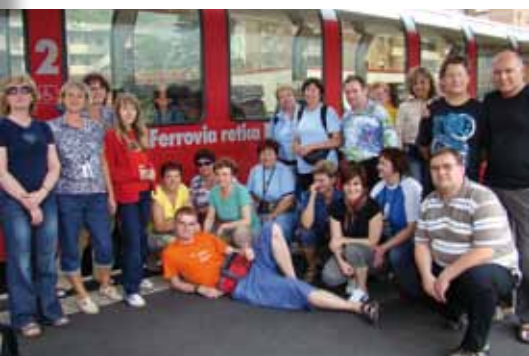
Slovenskí železničiarci po ceste v panoramatickom Bernina Expresse.