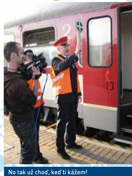
No tak už choď, keď ti kážem!