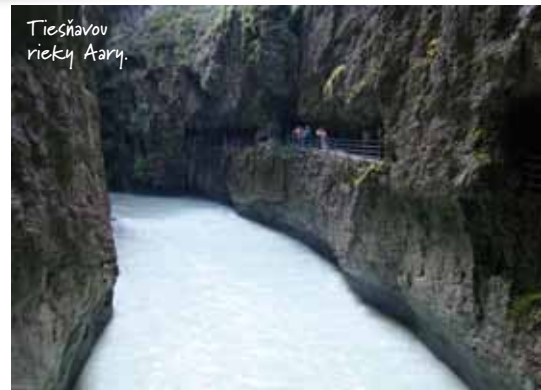
Tiesňavou riekou Aary.