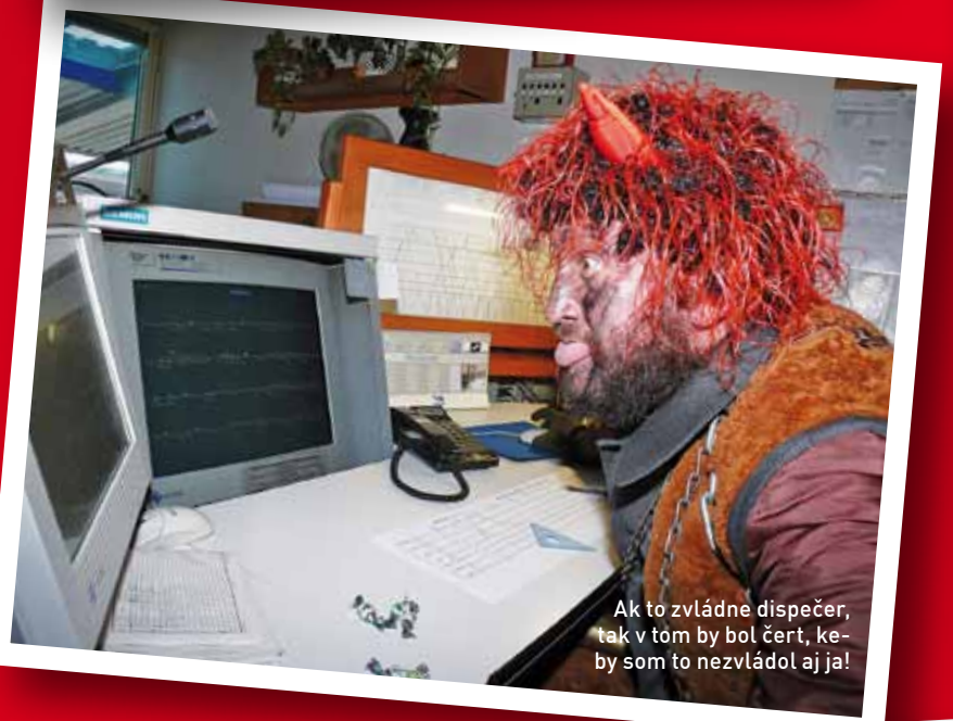
Ak to zvládne dispečer, tak v tom by bol čert, ke- by som to nezvládol aj ja!