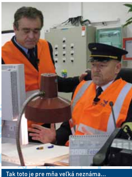
Tak toto je pre mňa veľká neznáma...