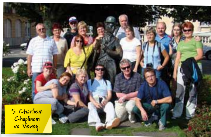
S Charlie Chaplinom vo Vevey.