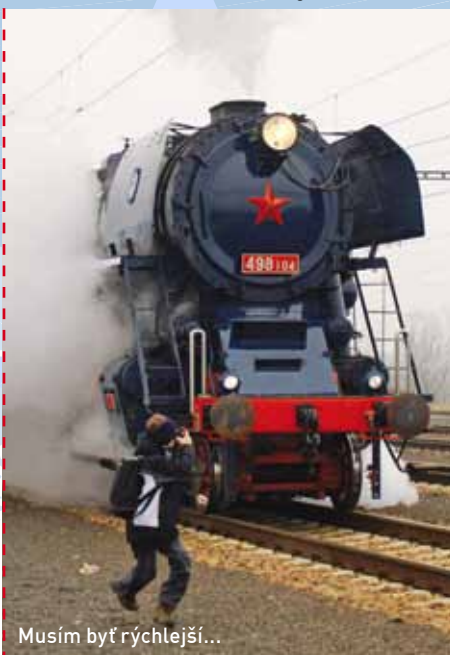
Musím byť rýchlejší...