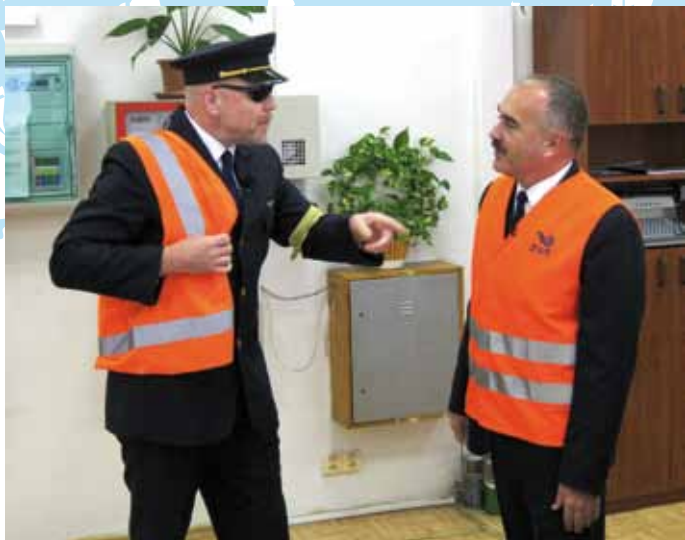
A ešte vestu a posledné prednostové pokyny pred vypravovaním...

železničiarov. Som rád, že mám možnosť si to skúsiť. –