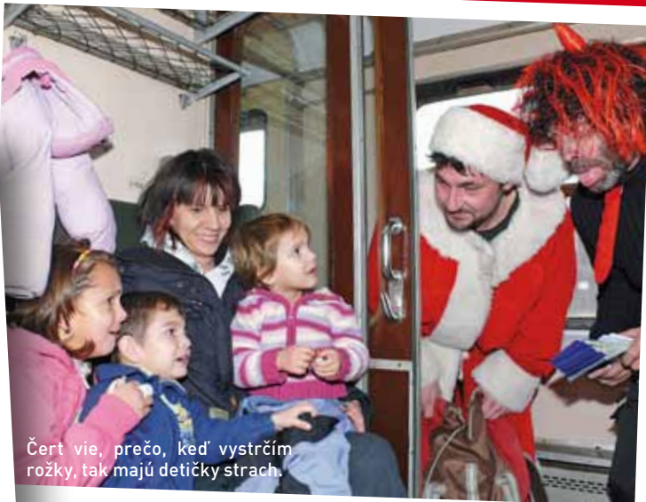
Čert vie, prečo, keď vystrčím rožky, tak majú detičky strach.