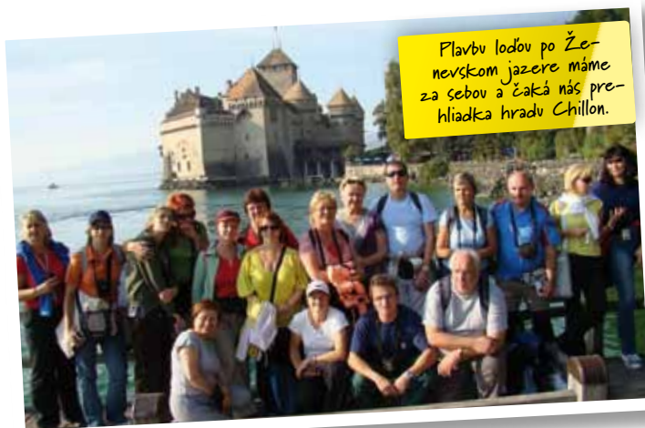
Plavbu loďou po Ženevskom jazere máme za sebou a čaká nás prehliadka hradu Chillon.