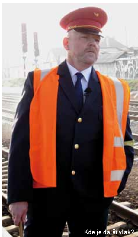
Kde je ďalší vlak?

skvelý, čo patrične ocení pán prednosta aj členovia markizáckeho štábu. A tak sa Marek s nádobou plnou oleja v ruke vydá namazať výhybky. Tu sa ukáže, že na herca je veľmi zručný a nestráni sa ani takejto práce. Po desiatkach minút vonku sa vymrznutý vracia späť do dopravnej kancelárie, opäť hlásenia a tentokrát ďalšia novinka – predaj lístkov. V stanici totiž čakajú cestujúci na osobný vlak. Po odbornom zácviku kolegu, s dobrými radami a odskúšanými grifmi na perfektné zvládnutie malého prístroja, vydá herec Vašut v mene výpravcu Vašuta prvé lístky. Má trochu problém s počítaním drobných centov, keďže v Čechách euro nemajú, ale pri dvadsiatom lístku je to bez problémov. Dokonca sedí aj stav pokladne.