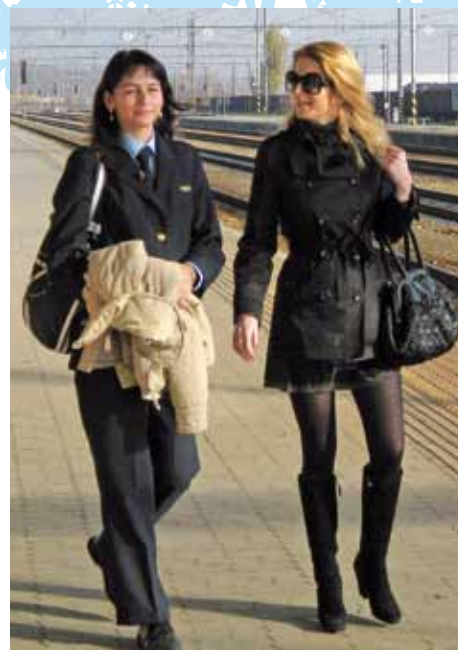
Pre Ingrid začína Skvelý deň.

Hlásim sa v službe! Len neviem či modrú, či červenú.