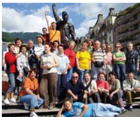
So sochou Freddieho Mercuryho v Montreux.

Viac informácií o zájazdoch organizovaných Záväzkom služieb železníc sa dozviete na: www.zajazdyzsz.estranky.sk