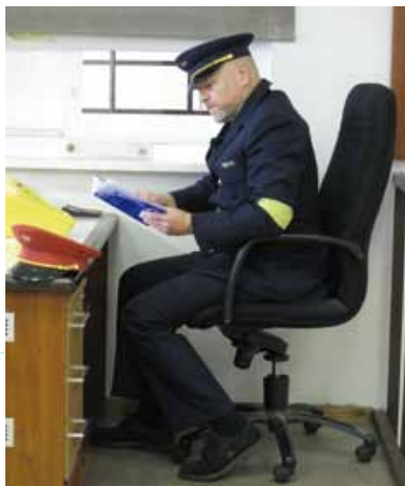
Keď nemám komu predávať lístky, tak si preštudujem prepravný poriadok.