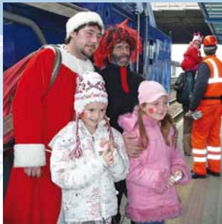
Na popradskej stanici si viacerí rodičia fotili Mikuláša s čertom aj so svojimi ratoľstami.