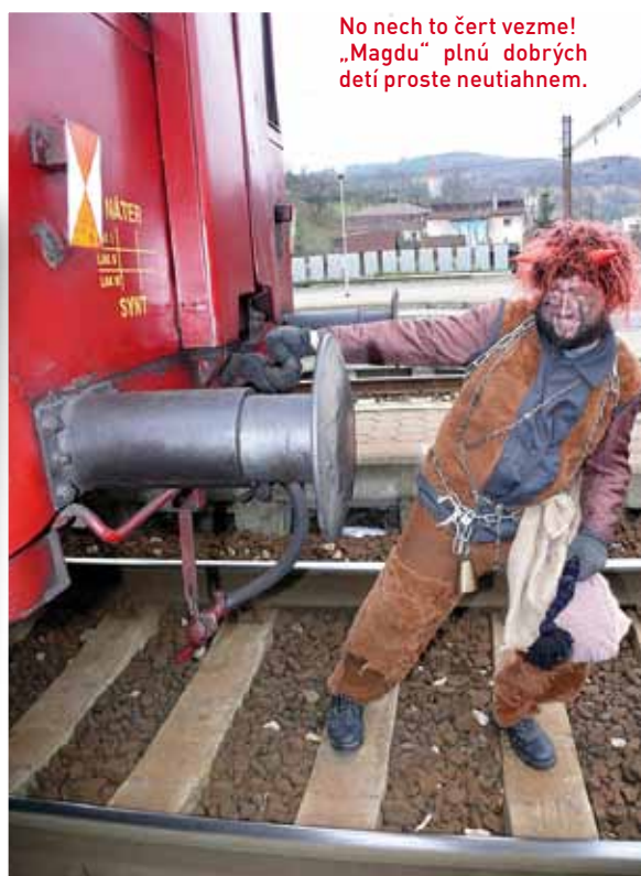
No nech to čert vezme! „Magdu“ plnú dobrých detí proste neutiahnem.